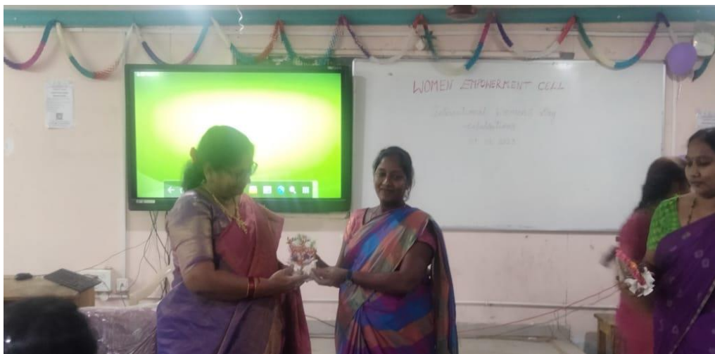
Distributing gifts to all the staff members by our principal madam