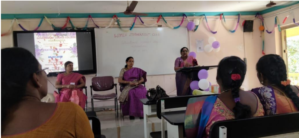
Our principal madam giving speech on women empowerment