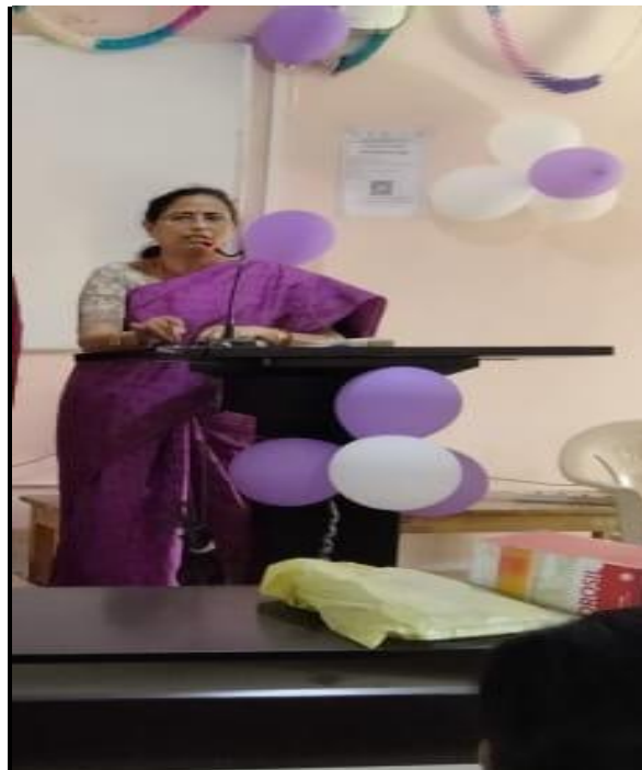
A speech by our vice principal madam